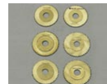
FRESE DA TAGLIO E SMUSSO.