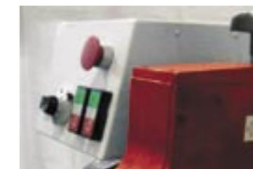
KIT ROTAZIONE MOTORIZZATA