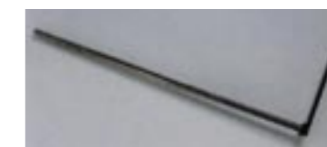
ASTA REGISTRAZIONE LUNGHEZZA TUBO.